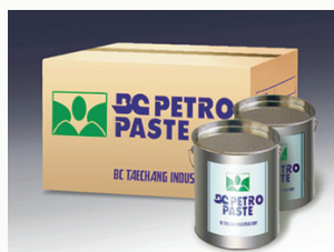
ПАСТА BC PETRO PASTE