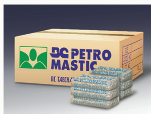
BC PETRO MASTIC