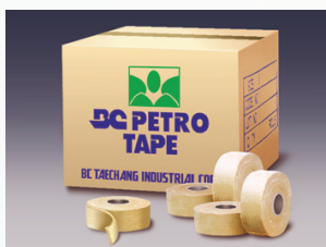
ЛЕНТА BC PETRO TAPE