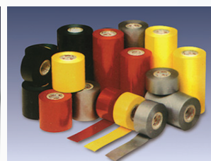
ПВХ ЛЕНТА FIRM TAPE